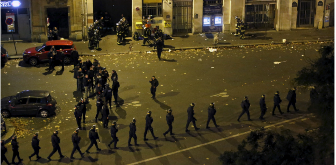
Paris, le 13 novembre 2015

Analyser les causes, chercher à comprendre ce qui anime les terroristes est la première étape permettant de pouvoir prévenir durablement ce mode opératoire utilisé par des ennemis déterminés à nous vaincre dans une guerre à outrance.