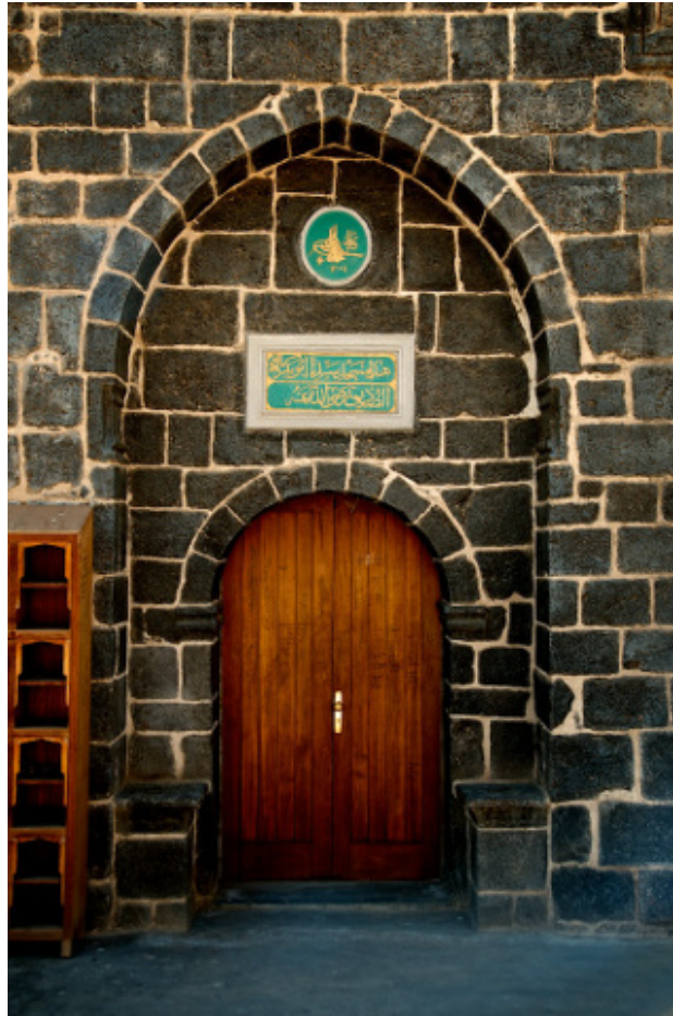
Porte de la mosquée d'Abu Bakr As Siddiq à Médine