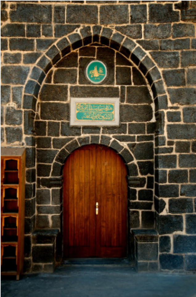
Porte de la mosquée d'Abu Bakr As Siddiq à Médine