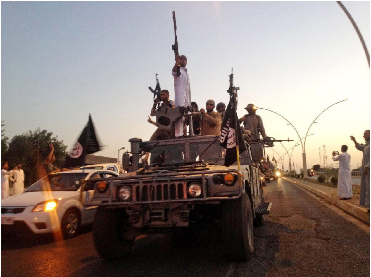
Combattants de l'EI paradant à Mossoul à l'été 2014, juchés sur des "Humvee" d'origine US récupérés, le plus souvent sans combattre, dans les dépôts abandonnés par l'armée

l'exploitation coordonnée de ressorts cognitifs et émotionnels au profit d'un but politique d'essence religieuse. Sa lecture marginalise les commentaires qui tendraient à faire passer les acteurs du jihad pour des aliénés mentaux ou des êtres primaires incapables de comprendre les subtilités propres à l'être humain. Elle souligne à quel point la compréhension d'un belligérant est tronquée quand on ne condescend pas à jeter un coup d'œil dans sa littérature de référence. Car les mécanismes du jihad tel qu'il est livré aujourd'hui sont bel et bien contenus dans une littérature stratégique dédiée. Le présent billet va vous en présenter certaines grandes lignes. Je vous invite, à terme, à prendre le temps de lire l'ouvrage pour en appréhender tous les ressorts (lien fourni en bas de page).