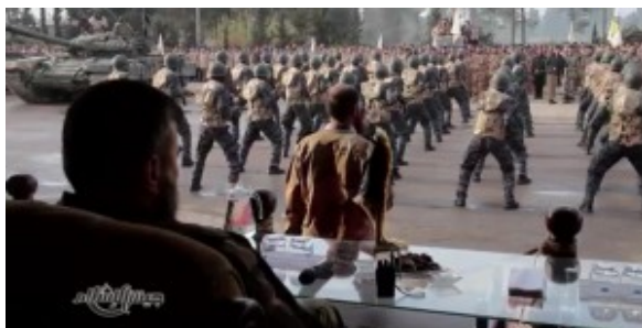
Parade à Douma du Jaish al-Islam sous le regard de Zahran Alloush

Sa milice bénéficie, grâce à son père, du soutien des réseaux privés salafistes des pétromonarchies et étend son influence. Il bénéficie d'un armement lourd (des tanks T-54, T-62 et T-72 ainsi que des blindés BMP), et même de quelques missiles sol-air 9K33 Osa (SA-8 Geko) qui lui permettent d'abattre des avions du régime qui bombardent quotidiennement l'enclave de la Goutha-est.