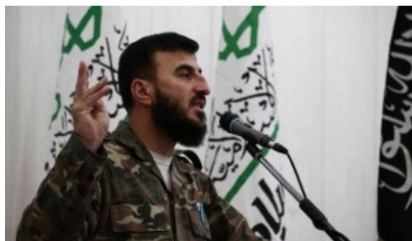
Zahran Alloush, tué dans un raid aérien le 25 décembre 2015