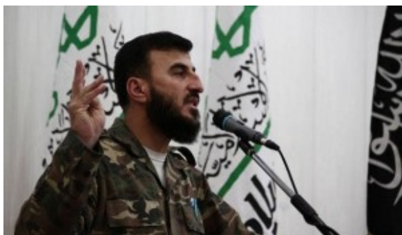
Zahran Alloush, tué dans un raid aérien le 25 décembre 2015

Zahran Alloush est né en 1971. Il est le fils d'un Sheikh sunnite syrien connu, Abdullah Mohammed Alloush, qui a été exilé en Arabie Saoudite pour son opposition au régime d'Assad. Très tôt impliqué dans un activisme religieux, Zahran Alloush est arrêté à plusieurs reprises par les services de sécurité syriens.