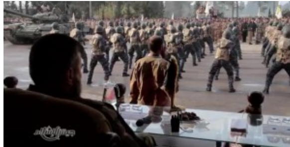
Parade à Douma du Jaish al-Islam sous le regard de Zahran Alloush

ainsi que des blindés BMP), et même de quelques missiles sol-air 9K33 Osa (SA-8 Geko) qui lui permettent d'abattre des aéronefs du régime qui bombardent quotidiennement l'enclave de la Goutha-est.