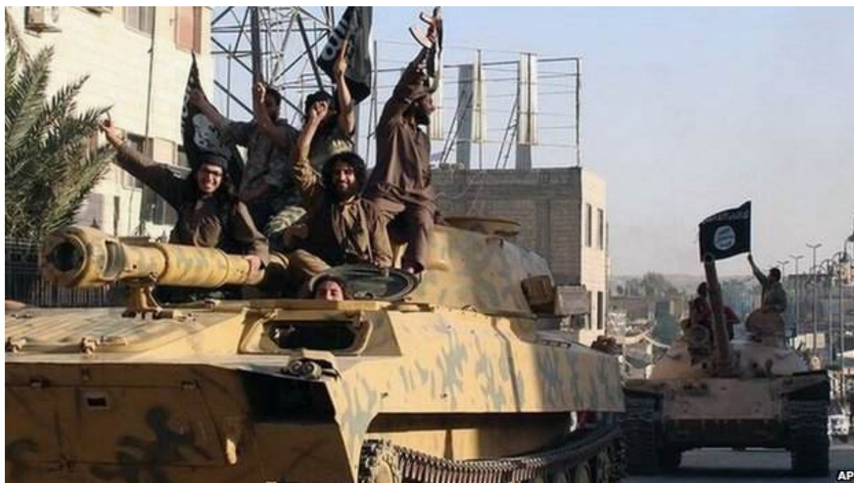
Image du passé: des blindés de l'EI circulant ouvertement, impunément, groupés, par grand beau temps. C'était avant la menace aérienne.

les combattants de leur liberté de manœuvrer et de communiquer pour épuiser le potentiel offensif de l'EI. Enrayer le train de bataille qui achemine vivres, munitions, pièces, carburant, matériels et combattants là où ils sont nécessaires pour éroder l'efficacité tactique de l'EI sur le terrain. Nuire à la transmission des ordres et informations pour interdire la coordination d'opérations de grande envergure. Appuyer les acteurs au sol de la proxy-war (3) dans leurs opérations offensives ou défensives face à l'EI pour reprendre le contrôle des territoires tenus par ce dernier. Mais cela ne va pas sans contraintes.