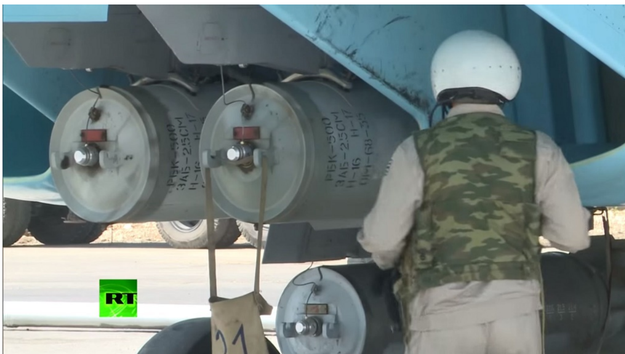
Bombes à sous-munitions incendiaires RBK-500 ZAB 2.5SM sous

Ici, deux principes doivent prévaloir. Le premier veut que la liberté d'expression n'implique pas le devoir sacré de dire n'importe quoi. En l'occurrence, il n'y a pas de politique de ciblage délibéré des infrastructures et populations civiles par la coalition. Il n'est pas prévu de destruction systématique d'hôpitaux et de marchés. Il n'y a pas de « deuxième couche » passée délibérément afin de trucider les primo-intervenants des services de secours. Le deuxième principe est que l'intention compte. Car oui, des civils sont tués par les bombardements occidentaux. Mais pour horrible que cela soit quand ça a le malheur d'arriver, soyons factuels: il faut être malhonnête, stupide ou bien les deux pour ne pas comprendre qu'à effort militaire égal, quand on fait tout pour tuer des innocents, on le fait beaucoup plus efficacement que si, au contraire, on essaie d'éviter les drames. Outre la dimension morale, l'intention ou non de tuer des innocents se traduit aussi à travers le nombre d'innocents que l'on tue.