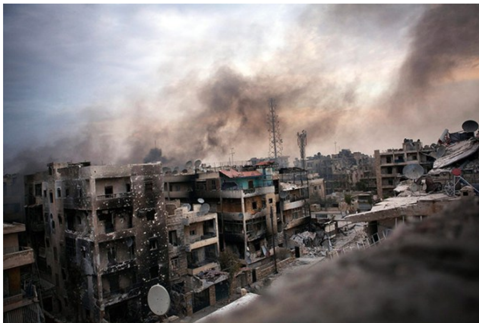
Alep sous le feu.

La crise qui a vu l'Arabie Saoudite rompre ses relations diplomatiques avec l'Iran le 3 janvier 2016 ne devait pas, selon Riyad, « compromettre les efforts de paix » pour la Syrie, censés s'exprimer à travers le « processus de Vienne » à l'occasion, notamment, d'un sommet devant se tenir à Genève début 2016. On le croit sans peine aujourd'hui encore, car les chances d'une issue favorable à ce processus semblaient d'ores et déjà pratiquement nulles avant même le dernier coup de sang diplomatique en date entre les deux principales puissances rivales de la région. D'ailleurs, les diverses pressions de dernière minute, dont certains craignent qu'elles fassent capoter le processus, ne crèveront sans doute guère qu'un pneu d'ores et déjà bien à plat. Voyons quels maux affectent les « processus de paix » qui, jusqu'à aujourd'hui, ont, sans exception, failli à leur vocation de mettre un terme à la sanglante guerre civile syrienne.