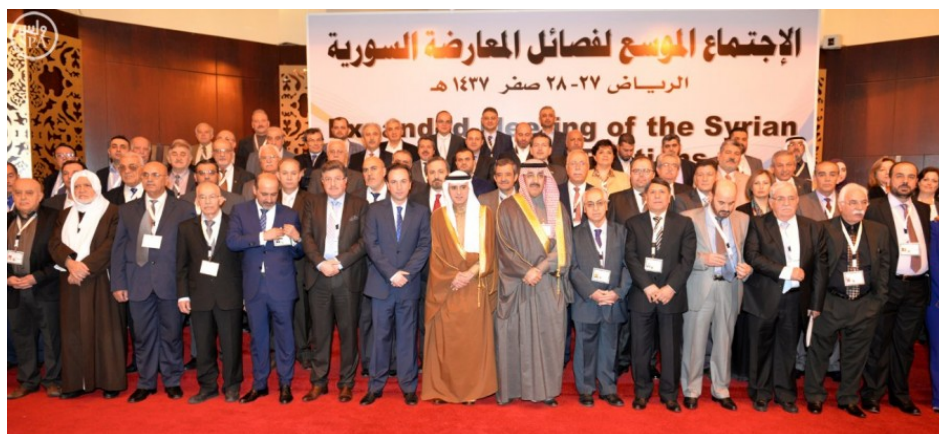
Les participants à la conférence de Riyad, le 9 décembre 2015