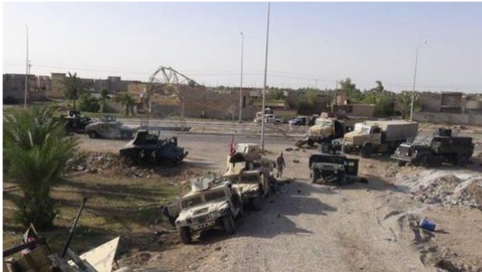
Véhicules militaires abandonnés par les forces irakiennes à Ramâdi

La prise de Ramâdi, chef-lieu de la province d'al-Anbâr, par l'Etat Islamique en Irak et au Levant (EI, EIIL, DAESH) (1) a fait l'objet du précédent billet de ce blog (2). On y évoquait les vieux démons de ce malheureux pays et leur influence sur le cours de la guerre. Aujourd'hui, des informations commencent à filtrer du terrain et à jeter une lumière crue sur un échec militaire, politique et administratif dont les répliques à terme n'ont sans doute pas fini de se faire sentir.