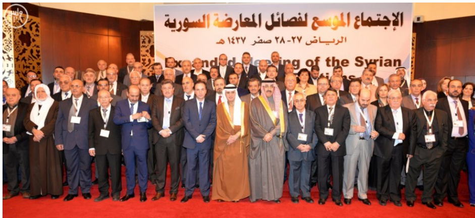
Les participants à la conférence de Riyad, le 9 décembre 2015