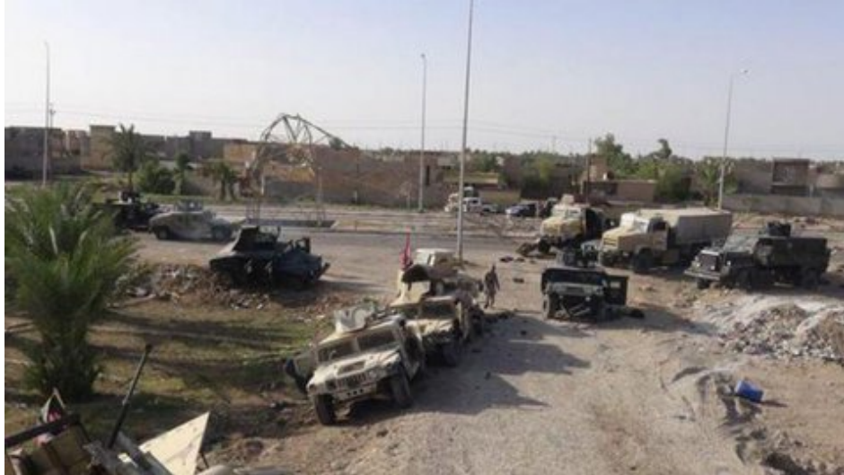
Véhicules militaires abandonnés par les forces irakiennes à Ramâdi

La prise de Ramâdi, chef-lieu de la province d'al-Anbâr, par l'Etat Islamique en Irak et au Levant (EI, EIIL, DAESH) (1) a fait l'objet du précédent billet de ce blog (2). On y évoquait les vieux démons de ce malheureux pays et leur influence sur le cours de la guerre. Aujourd'hui, des informations commencent à filtrer du terrain et à jeter une lumière crue sur un échec militaire, politique et administratif dont les répliques à terme n'ont sans doute pas fini de se faire sentir.